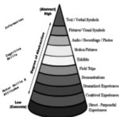
図1 デールの経験の円錐 (オリジナル)

記憶について、実験によって証明しようとしたものに、エビングハウスの忘却曲線がある (図